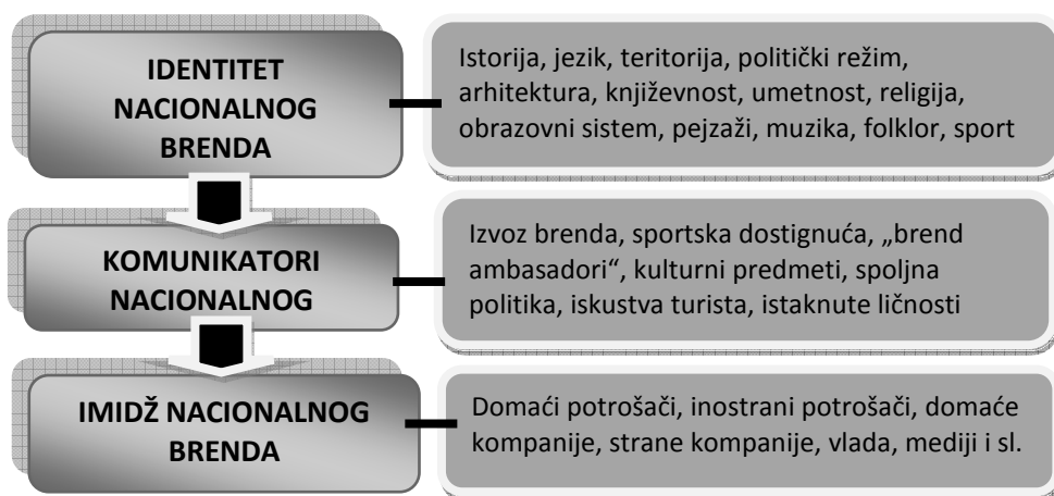
Slika 1. Identitet i komunikatori nacionalnog brenda

Olins. Uz njih kao pionire nacionalnog brendiranja, značajan doprinos dao je i Fan (2006) koji ukazuje na razlike prilikom definisanja procesa nacionalnog brenda ( nation brand ) i termina interni brend ( national brand ). Naime, nacionalni brend je višedimenzionalni entitet sastavljen od sledećih vrednosti (Brand Magazin, 2010): kvalitet proizvoda i usluga, inventivnost, kreativno preduzetništvo, poslovna dinamika, obrazovanu i kvalifikovanu radnu snagu, optimalne kapacitete za odmor, rekreaciju i zabavu, kvalitetnu infrastrukturu i prirodno okruženje.